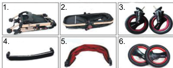
1.Ram kolica; 2.Sedište/kolevka; 3.Prednji točkovi 4.Branik; 5.Tenda; 6.Zadnji točkovi

Deca ne bi trebalo da sklapaju ili otvaraju kolica, sastavljaju ili rastavljaju delove kolica. Kolica moraju biti sastavljena od strane odrasle osobe.